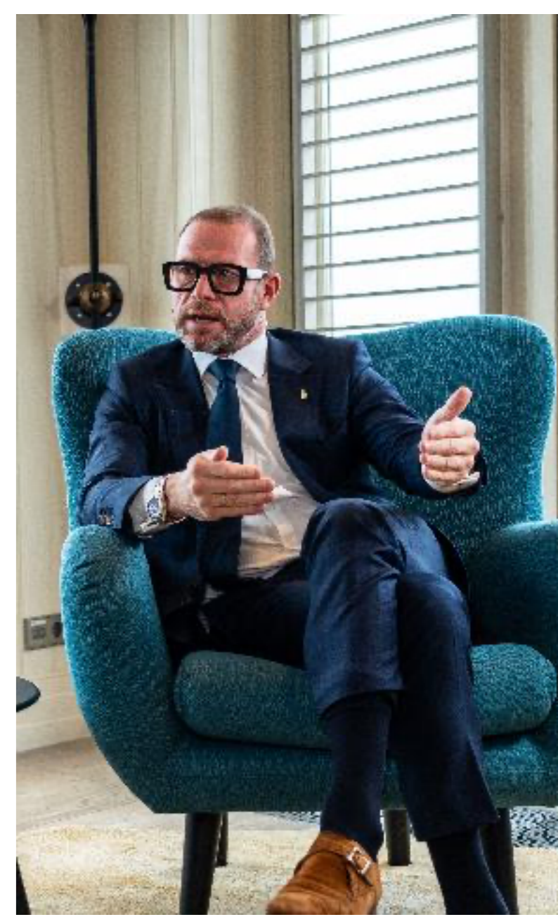
Aangeboden door Zicht op Zaken. Daarom maken gasten in duurste hotelkamers het meeste kapot.