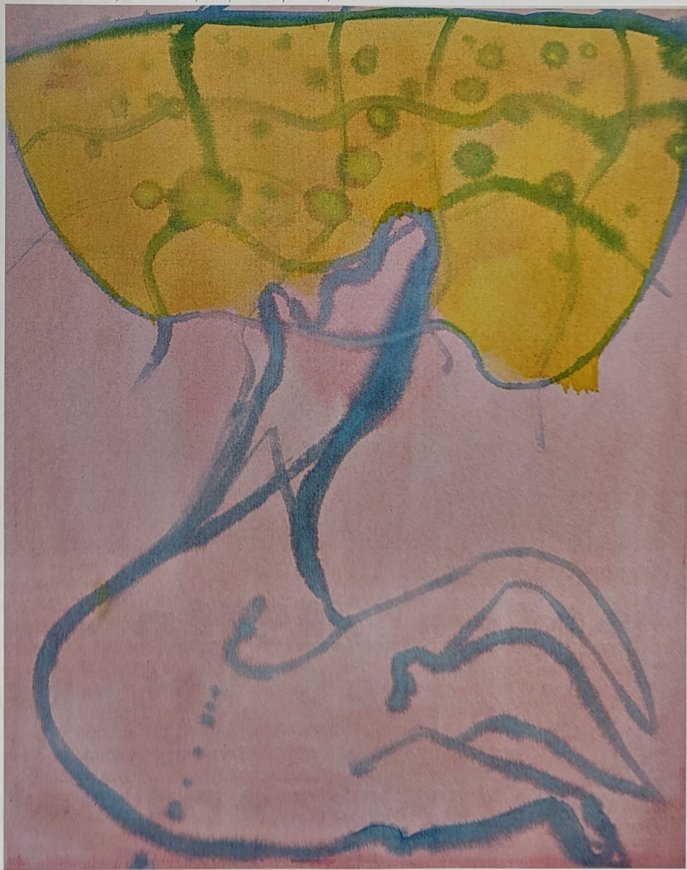
Rinella Alfonso, Monster cloth , 2019, olieverf op canvas, 113 x 91 cm