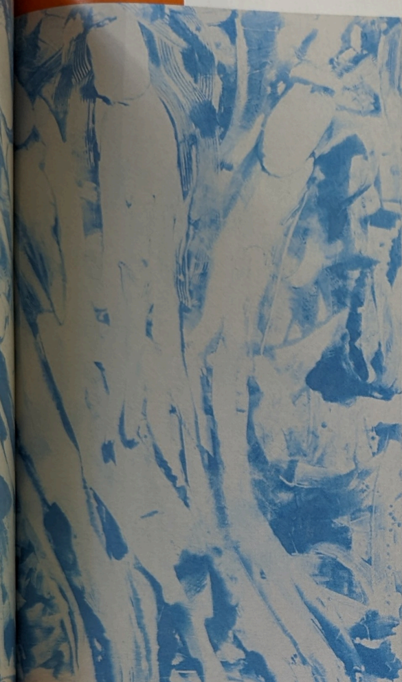
Rinella Alfonso, Stiletto's , 2021, olieverf en lak op canvas, 160 x 190cm