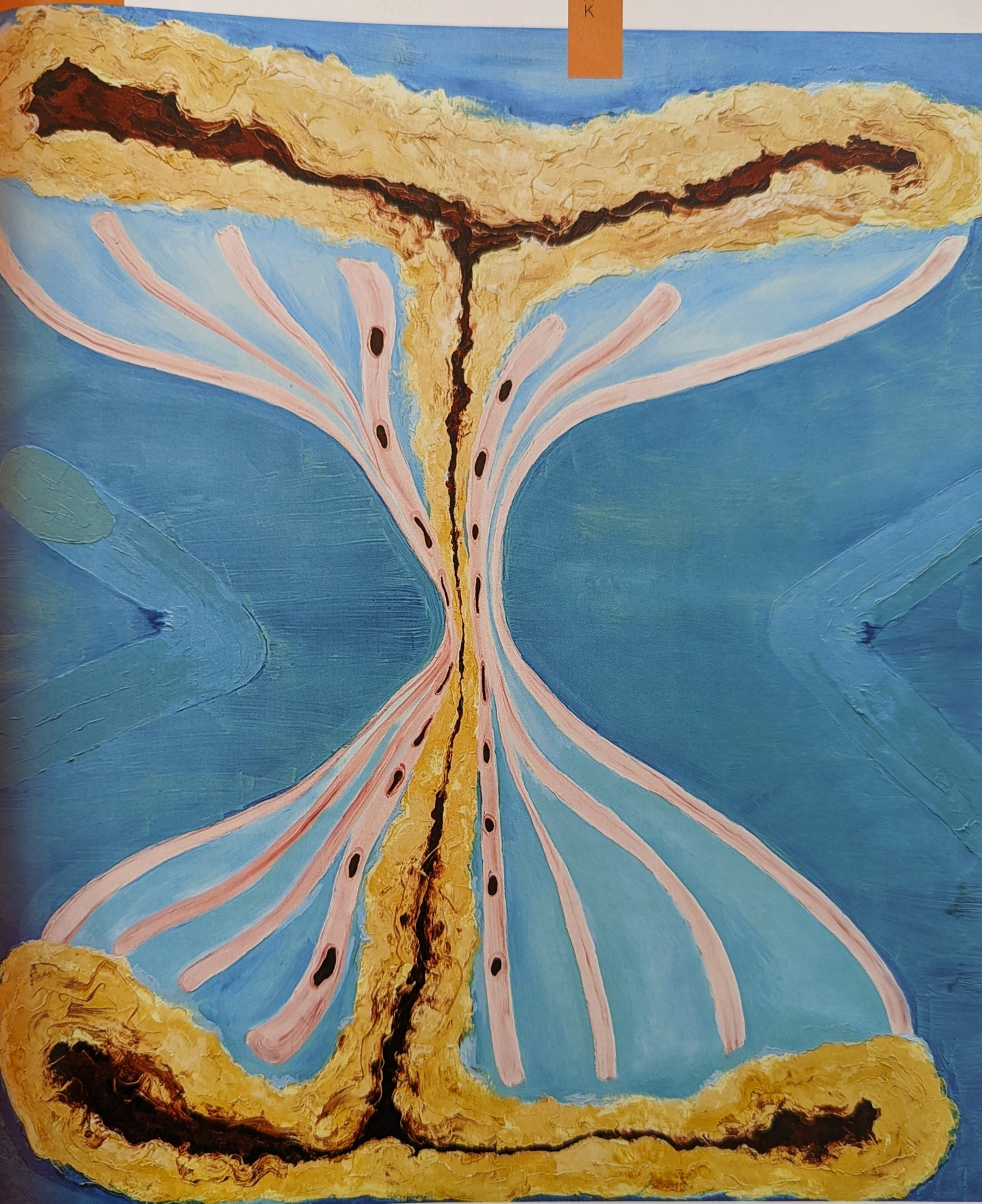
Rinella Alfonso, Corset , 2019, olieverf op canvas, 163 x 144 cm